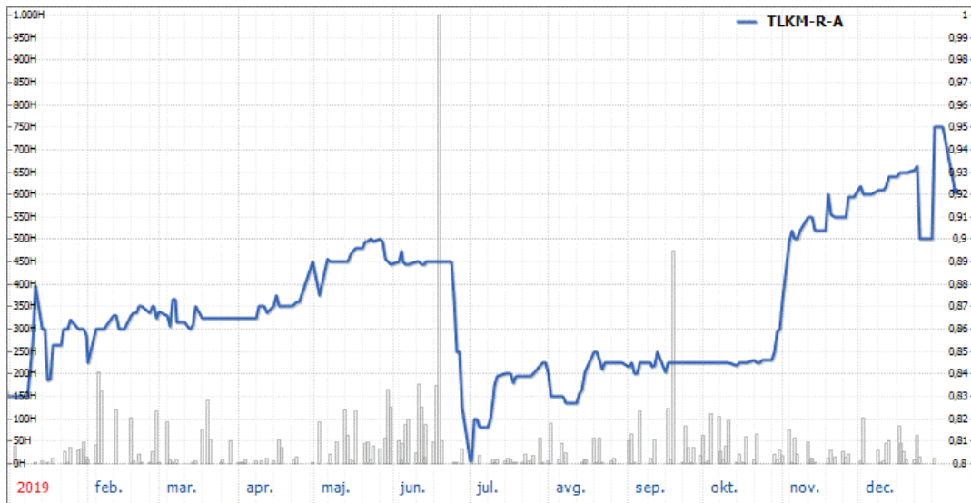
Kretanje cijene akcija Telekoma Srpske a.d. Banja Luka u 2019. godini

Na tržištu akcija je porastao redovan promet i najviše se trgovalo akcijama Telekoma Srpske čija cijena je porasla za 14,46%. Telekom Srpske je akcionarsko društvo koje je isplatilo najveću dividendu u 2019. godini i akcionari su po osnovu dividende mogli da ostvare prinos od oko 12%. Zbog toga su i protekle godine akcije Telekoma Srpske bile najatraktivnije za male ulagače.